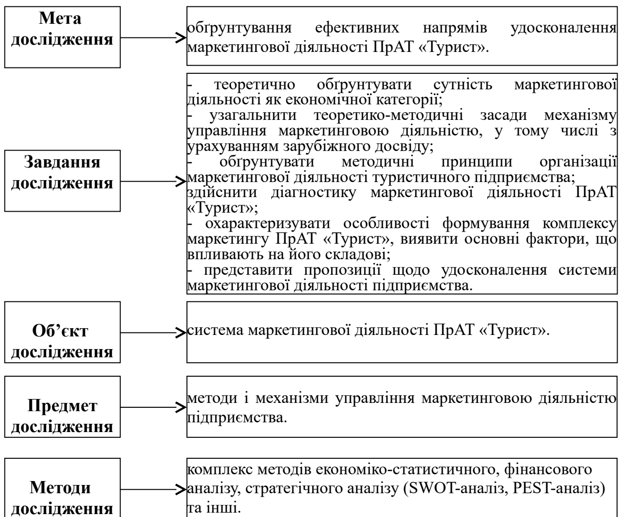
Рис. 1. Структурно-змістовна схема проведеного дослідження

Сторінка 3 –.... Основні положення результатів дослідження, представлені у вигляді таблиць, діаграм, схем, картосхем та рисунків.